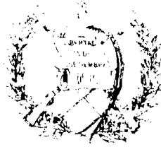
Oswin René Morales Flores