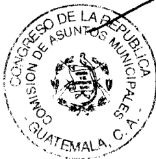
Mirma Figueroa de Coro