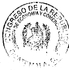
Marco Vinicio Cerezo Arevalo