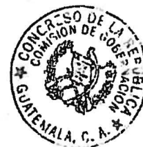
Orlando Joaquín Blanco Lapola