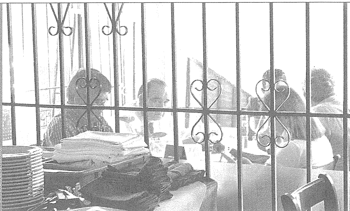
LOS DOBLES DE EL PERIÓDICO